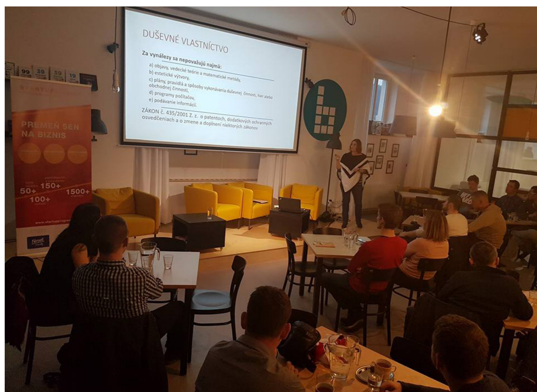
Obr. 2: Prednáška na tému DV na podujatí RightsUp v Banke Žilina

Verejnosť má možnosť získať patentové informácie aj v Stredisku patentových informácií – PATLIB centre, ktoré bolo zriadené v spolupráci s Úradom priemyselného vlastníctva SR na pôde UNIZA.