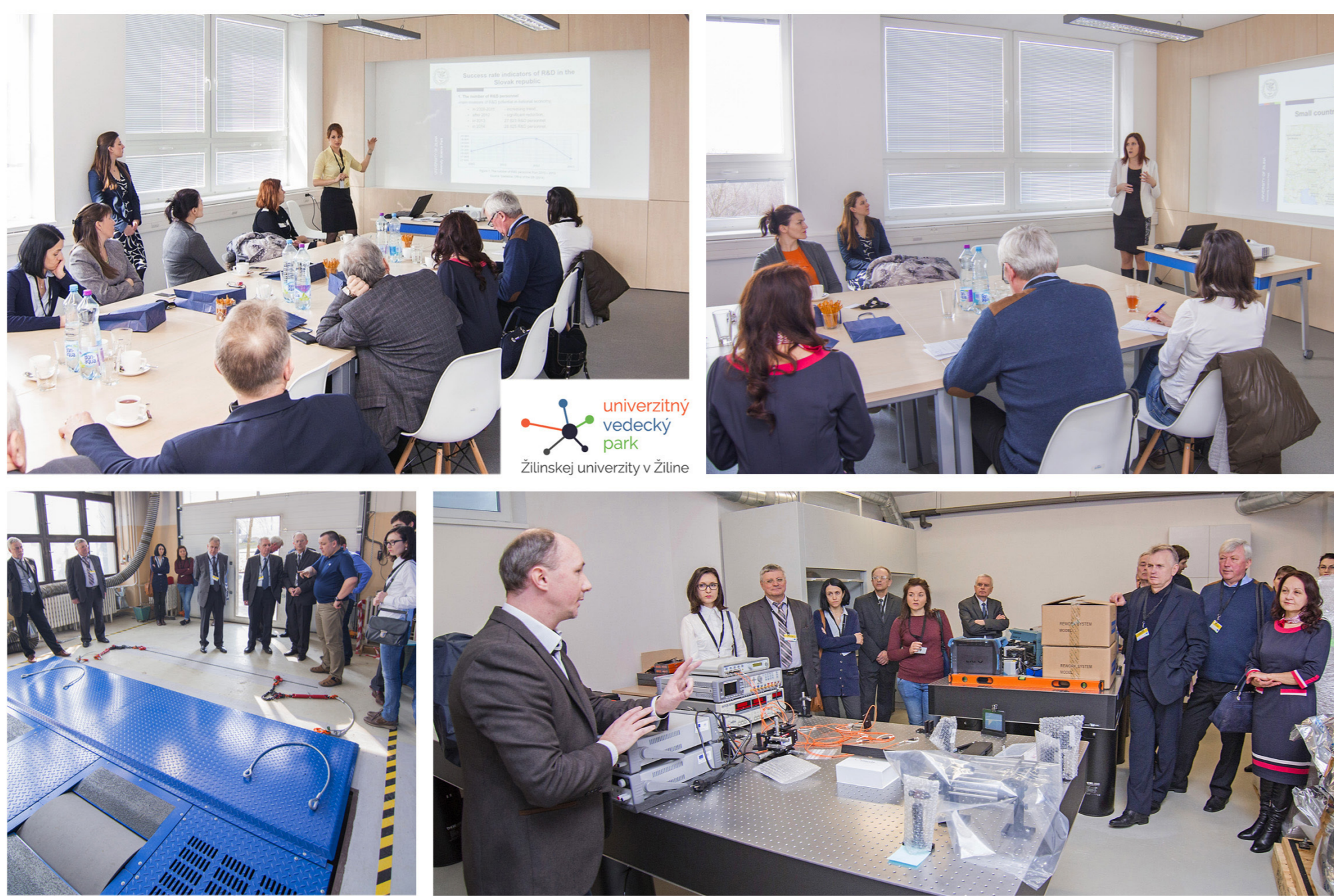
Obr. 1: Prezentácia CTT a laboratórii UVP partnerom z Moldavska,

V záujme podpory vzdelanosti malých a stredných podnikov a širokej verejnosti v oblasti patentových informácií a priemyselného vlastníctva je v priestoroch UNIZA zriadené informačno-poradenské miesto Úradu priemyselného vlastníctva SR pre inovácie – Innoinfo.