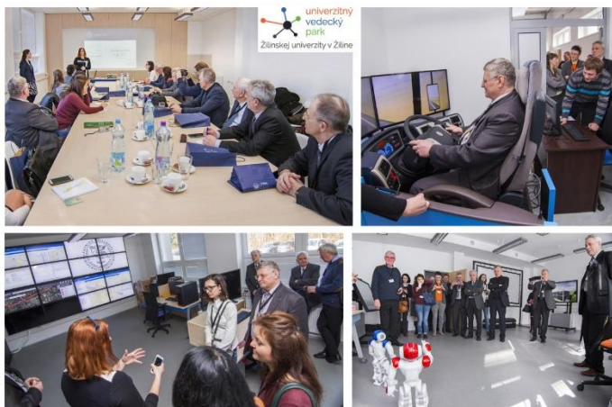
Obrázok: Prezentácia CTT a laboratórií UVP partnerom z Moldavska, Ukrajiny a Bieloruska

Centrum pre Transfer technológií Žilinskej univerzity v Žiline (CTT UNIZA) bolo vybudované v rámci projektu Univerzitného vedeckého parku Žilinskej univerzity v Žiline, poskytuje však svoje služby pre celú Žilinskú univerzitu. Zaoberá sa riadením práv duševného vlastníctva a transferom výsledkov výskumu a vývoja do praxe. Jeho cieľom je prepojenie výskumného potenciálu UNIZA s potrebami komerčnej sféry.