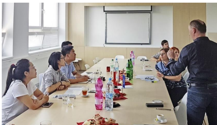
Obrázok: Diskusia so zástupcami čínskej delegácie

V záujme podpory vzdelanosti malých a stredných podnikateľských subjektov a ostatnej verejnosti v oblasti patentových informácií a priemyselného vlastníctva uzavreli UNIZA a Úrad priemyselného vlastníctva SR Dohodu o spolupráci, ktorej výsledkom je zriadené informačno-poradenské miesto Úradu priemyselného vlastníctva SR pre inovácie – Innoinfo v priestoroch UNIZA. V priestoroch UNIZA je tiež na základe spolupráce s ÚPV SR zriadené PATLIB centrum – Stredisko patentových informácií, ktorého úlohou je poskytovať verejnosti informačné služby v oblasti patentových informácií.