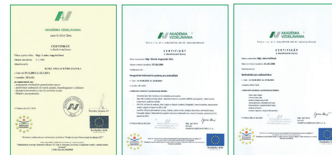
Certifikáty – absolvovania kurzov a školení