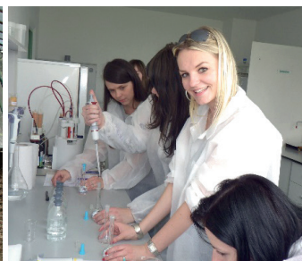
Odborné praxe študentov na združenom pracovisku Prešovskej univerzity a súkromnej firmy