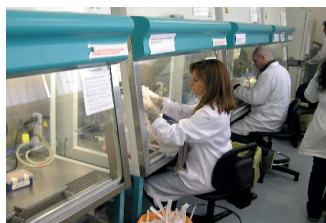
České Budějovice, Česká republika