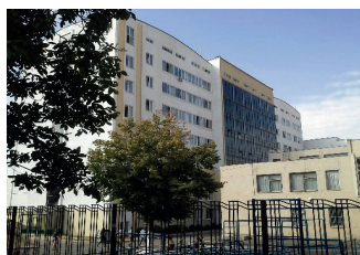
Odesa, Ukrajina, Národná ekologická univerzita