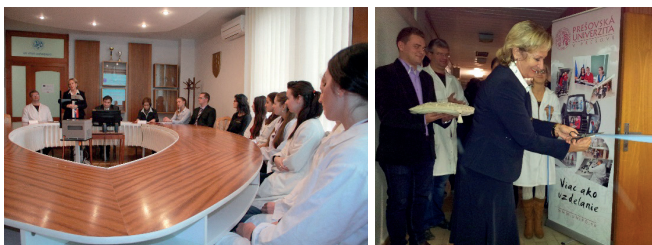
Publicita – tlačové konferencie, otvorenie a využitie laboratórií pre výučbu